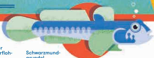
Schwarz- mund- grundel