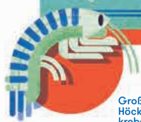
Großer Höckerfloh- krebs