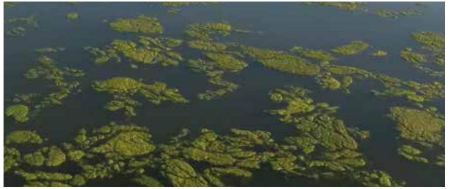
Früher waren Algenteppiche am Bodensee ein häufiges Bild.

Seenforscher schlugen deshalb bereits in den 1950er Jahren Alarm. Nährstoffe, die vor allem mit ungereinigtem Abwasser in den See gelangten, ließen Pflanzen und pflanzliches Plankton kräftig wachsen. Wegen der damit verbundenen Gefahr für die bis dahin hervorragende Wasserqualität des Bodensees wurde dann 1959 in St. Gallen die Internationale Gewäs-