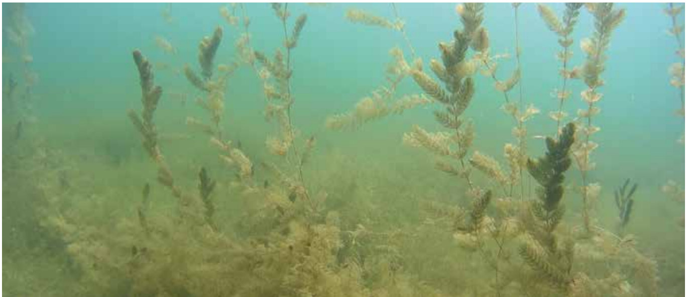
Wasserpflanzen sind nicht nur schön anzusehen, sie erfüllen auch wichtige ökologische Funktionen. (Bild: Inst. f. Landschaftsök., Uni. Hohenheim)

Vor 50 Jahren war die Wasserqualität des Sees so schlecht, dass Seuchen drohten.