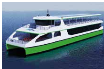
Visualisierung des Elektro-Passagierschiffs der BSB.

ab. So gaben die Bodensee-Schiffsbetriebe (BSB) Ende 2020, den Bau von zwei elektrisch betriebenen Passagierschiffen für je 300 Passagiere bekannt. Das erste Schiff soll den Betrieb im Sommer 2022 aufnehmen und im Überlinger See eingesetzt werden.