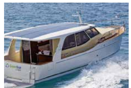
Ein Hybrid-Boot mit Solarzellen auf dem Dach.

Der Konstanzer „Südkurier“ spricht von „leiser Zukunftsmusik“. Am zweiten Trägertreffen zur E-Charta im Oktober 2020 allerdings tönnte es optimistisch: „E-Mobilität auf dem Bodensee ist möglich und technisch wie wirtschaftlich machbar – schon heute!“, so die Schlusserklärung.