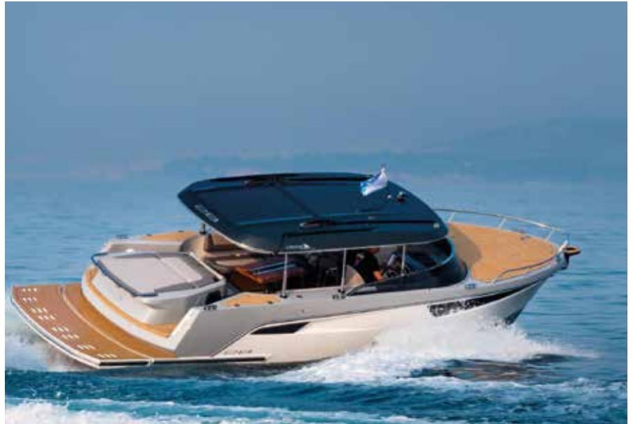
Auch ansehnliche Yachten lassen sich mit Elektromotoren ausrüsten.

Inzwischen zeichnen sich auch auf dem See erste Resultate dieser Strategie