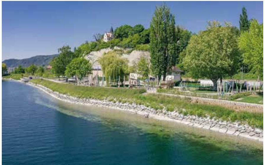
Die ökologische Aufwertung in Überlingen stellt einen gelungenen Kompromiss dar.

Ganz allgemein sind natürliche Seeufer und Fließgewässer wertvolle Lebensräume, sie bieten vielfältige Strukturen für eine angepasste Flora und Fauna, und sie vernetzen Lebensräume miteinander, etwa als Übergangsbereich zwischen Wasser und Land oder zwischen See und seinen Zuflüssen. Der Schutz