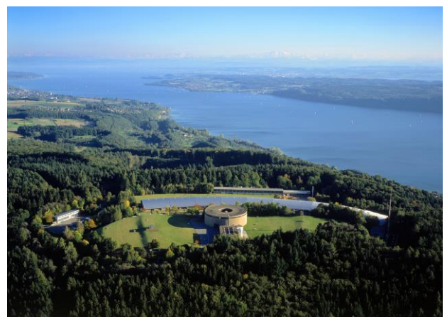
Abb. 1: Luftaufnahme der Bodensee-Wasserversorgung auf dem Sipplinger Berg.

Aktuell sind dies rund 4,1 m 3 /s, in erster Linie infolge der Entnahme durch die BWV in Sipplingen (Abbildung 1), die fast ausschließlich aus dem Einzugsgebiet Bodensee abgeleitet werden. Auch die Regionale Wasserversorgung St. Gallen (RWSG), als zweitgrößte Wasserentnahme mit 0,29 m 3 /s, führt gut die Hälfte des gewonnenen Wassers in ein anderes System ab.